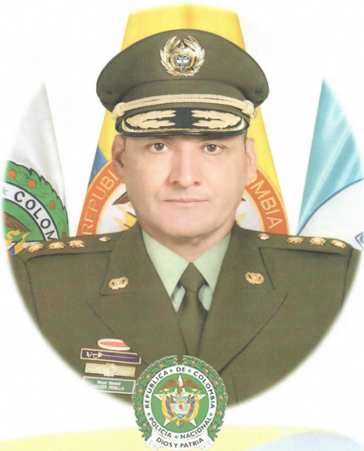
Mayor General HOOVER ALFREDO PENILLA ROMERO