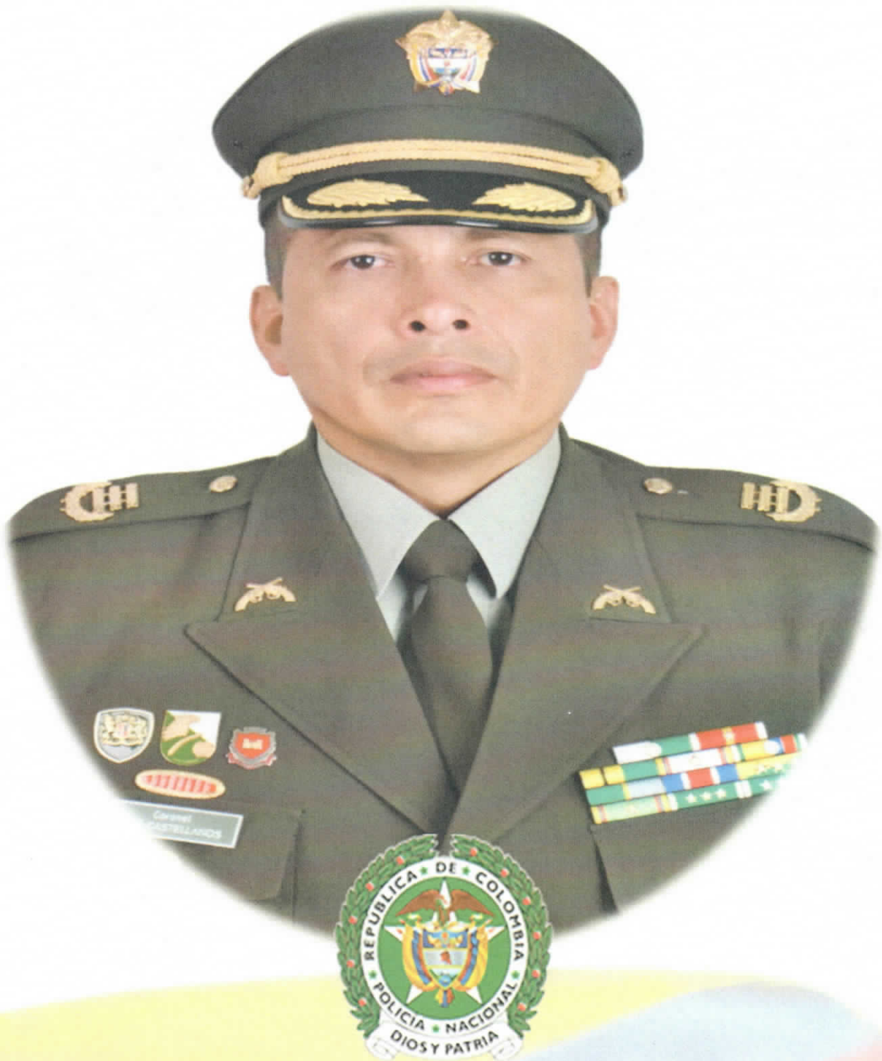
Coronel TITO YESID CASTELLANOS TUAY