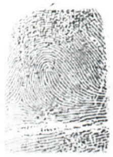
IMPRESION DE DERECHO